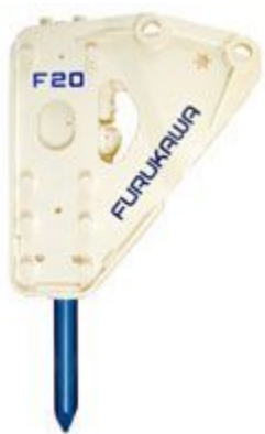
セットプレートタイプ