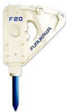
セットプレート・ショートスカートタイプ