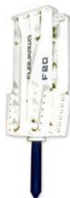
サイドプレートタイプ