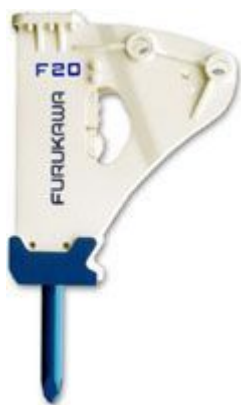
サイドブラケット(ダンパ)タイプ